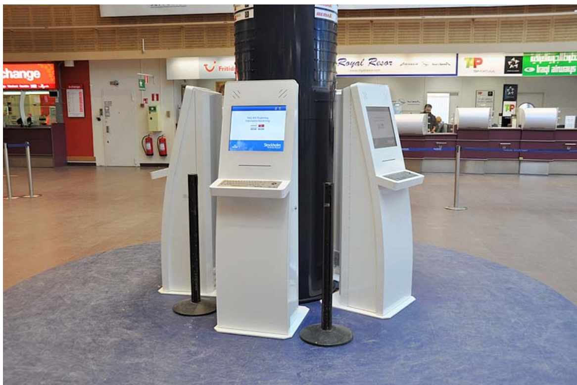
InternetKiosker Arlanda Flygplats

För Megatecs produkter krävs CE godkännande avseende elektrisk säkerhet och elektromagnetisk strålning mm, EMC. Produkterna testas kontinuerligt på ackrediterat testinstitut, testprotokoll finns. Betalsystem med chip-kort möter EMV specifikationerna och är PNC SAC godkända.